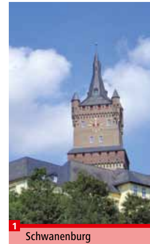
wikipedia (Rolf Cosar)